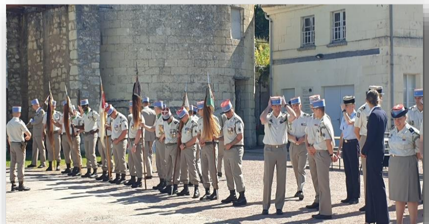
Passation de commandement du 24/06/24