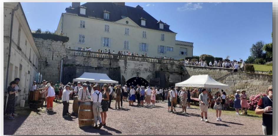
Anjou Vélo Vintage 2024 – Château de la Fessardière