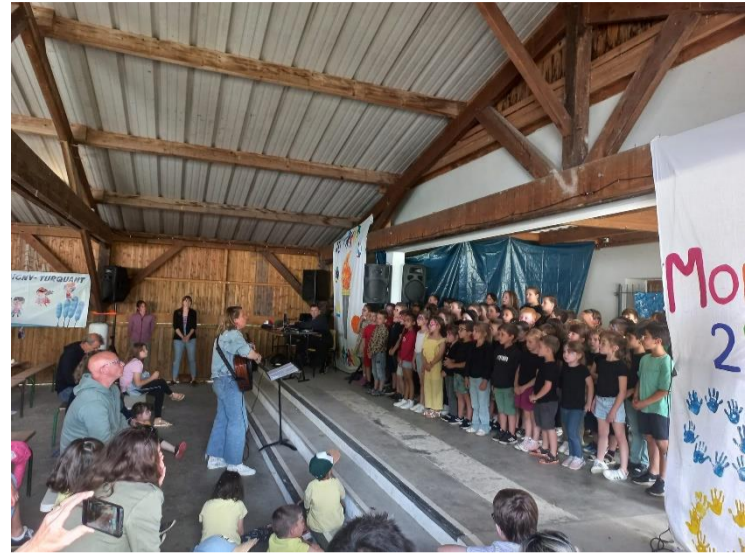
Fête des écoles du Syndicat de la Côte